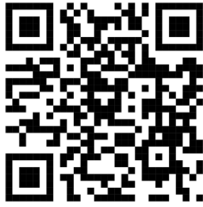
QR Code แบบฟอร์มใบสมัครการแข่งขันแคนูโปโล